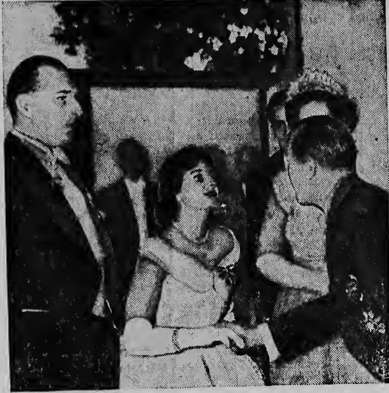
INFANTA MARIA DEL PILAR, 18, daughter of Princess Maria Mercedes and Don Juan, pretender to the Spanish throne, is shown as she made her debut at a glittering ball in Estoril, Portugal. She stands between her parents as she is introduced to Duarte Nuno, pretender to the Portuguese throne. More than 2,000 persons attended the reception held in Don Juan's villa and heard him call on the monarchists to "unite in a sacred vow around the crown." Spain's throne has been vacant since Alfonso XIII left the country in 1931.